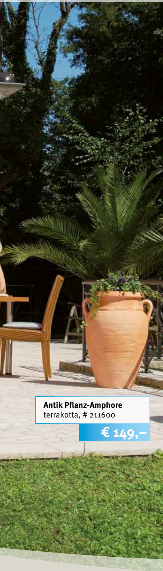
Antik Pflanz-Amphore terrakotta, # 211600